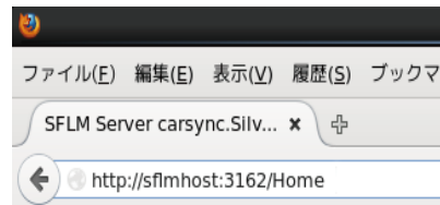
図2: サーバホスト名が sflmhost の場合